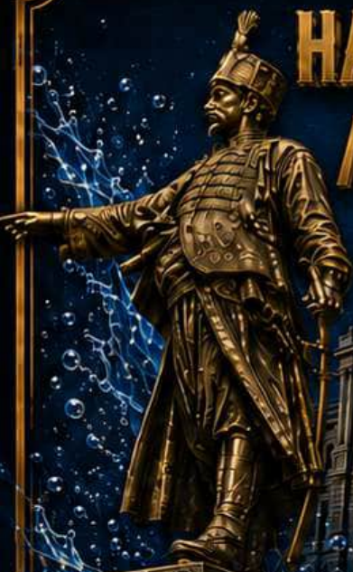
МИЛОШ ОБРЕНОВИЋ 1780 – 1860